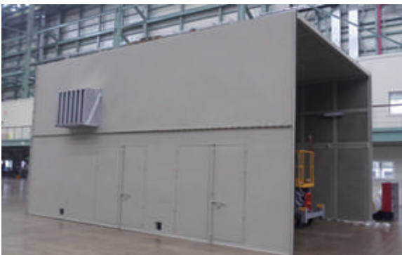
▲ 공기압축기 시험용 Enclosure