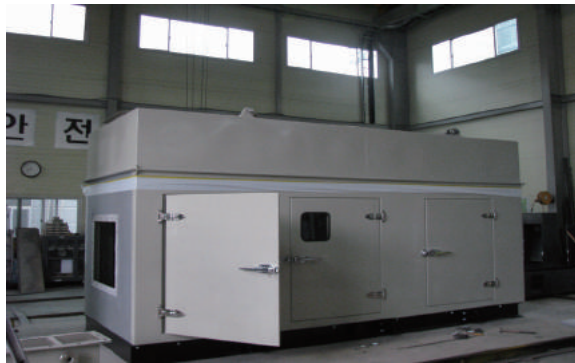
▲ 비상발전기 Enclosure