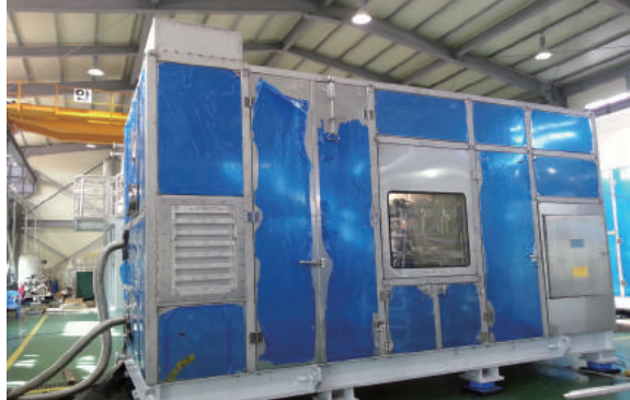
▲ 저소음 대형 공기압축기 Enclosure