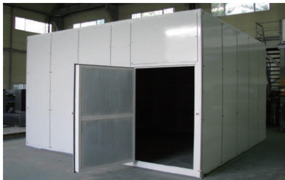
▲ 장비 측정용 Enclosure