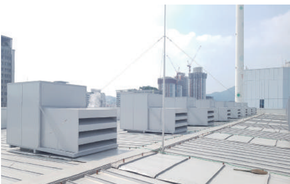
▲ Roof Fan Enclosure