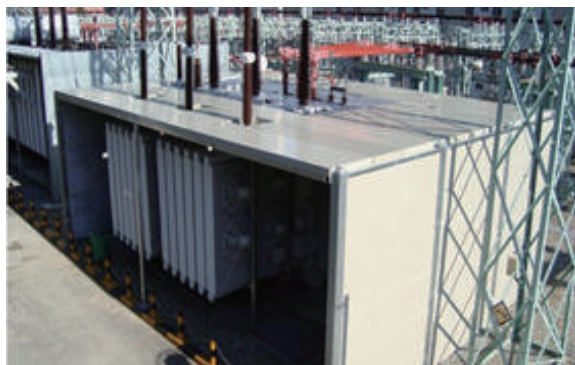
▲ 변전소 변압기용 Enclosure