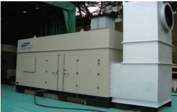
▲ 비상발전기 Enclosure / 배기가스 Silencer