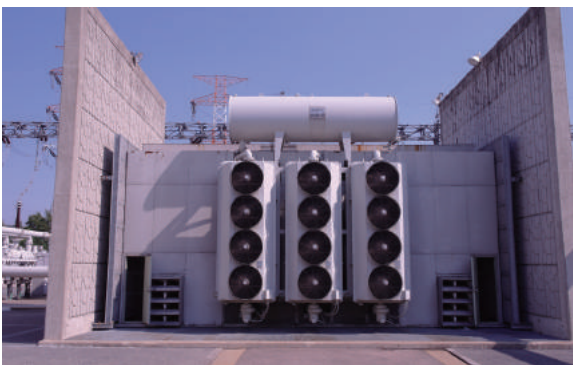
▲ 변전소 변압기용 Enclosure